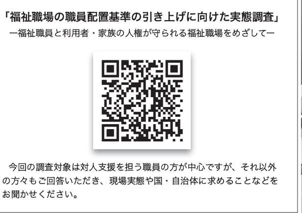
「福祉職場の職員配置基準の引き上げに向けた実態調査」 —福祉職員と利用者・家族の人権が守られる福祉職場をめざして—