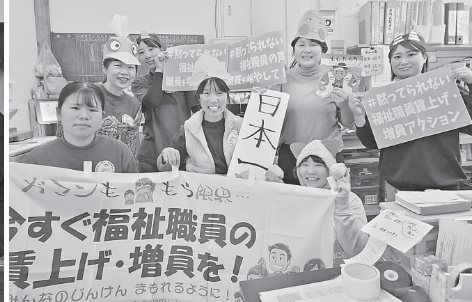
【鳥根】わかたけ保育園分會、卒園児を送る会の「もたろう」劇のあとで