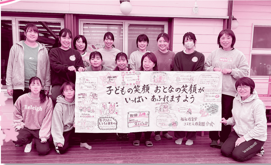
3月14日に賃上げと増員を求めて手づくりの横断幕を掲げた群馬支部コスモス保育園分会

新しい職員とともにあたたかい春を迎え、4月が始まりました。子どもたちや高齢者、障害者とその家族を支える私たちの仕事。やりがいや誇りがある一方で、不安や悩みも少なくありません。福祉職場で働くみんなの労働組合・福祉保育労を紹介して、みなさんに加入をよびかけます。