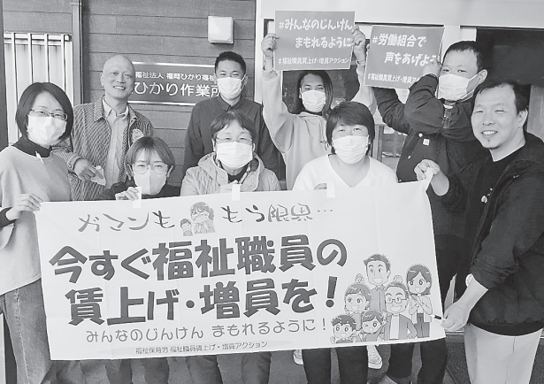
【福岡】ひかり作業所分會 (障害福祉)、この日は団交でべア回答も