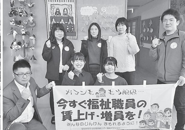
【山形】最上支部 (児童養護施設) で集まって

滋賀支部・おおつ福祉分会は、「賃上げUP」「職員の増員」に加え、ポケットチェックシートなどで要求が多かった「年休をとりやすさ」の文言も入れ、事務室の書類類に書き込むプラカードには、組合員が願いを書き込めるようにしました。ワッペンを配布しながら、