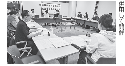
東京の会場とオンライン併用して開催

高齢種別協議会総会 10月9日 東京会場とオンライン 10月9日に、東京会場とオンライン併用で、高齢種別協議会の総会を開催しました。現地開催は4年ぶり、6地方組織から19人が出席しました。総会前日の全労連介護・ヘルパーネット総会への参加もよびかけ、5人が出席。総会後にも、学習交流として第21回全国介護学習交流会に参加しました。 総会では、議長の開会あいさつと、運動方針案を事務局が提案しました。地方組織の討論では、3つのテーマで8人から発言がありました。京都地本からは、ある分会では春闘統一行動日に職免(職務免除)をとり、自治体などへの要請行動にも参加。今回は実施できなかった時限ストにむけて、未加入職員も含めた職員にGoogleフォームアンケートを実施したところ、回答は約200人にとどまりました。ストに賛成が多いという結果も踏まえて、ストにむけた決意が示されました。