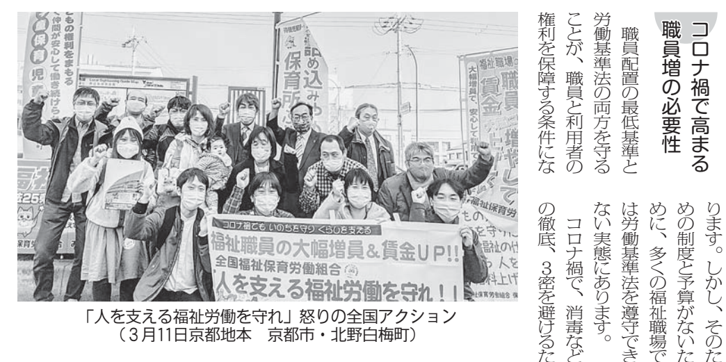
「人を支える福祉労働を守れ」怒りの全国アクション (3月11日京都府 京都市・北野白梅町)