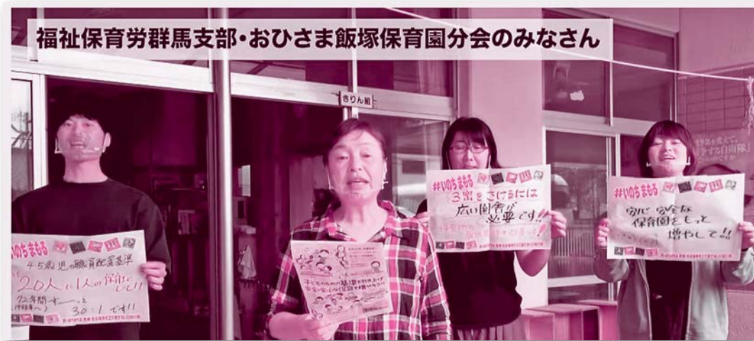
福祉保育労群馬支部・おひさま飯塚保育園分会のみなさん