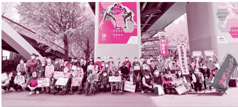
東海地本が関係団体ととりくんだ「福祉予算削るな！福祉を金儲けにするな！愛知県民集会」の後の署名宣伝行動で（10月30日）

福祉保育労では、この秋から国会請願署名「福祉職員の大幅な賃金の引き上げと増員を求めます」にとりこんでいます。政府は福祉職員の賃上げをすすめてきましたが、規模も対象も不十分です。また、増員は社会的養護などに限定され、ほとんどの分野では基準の緩和がすすめられてきました。1～3面の特集を踏まえて、署名を広げていくことをよびかけます。