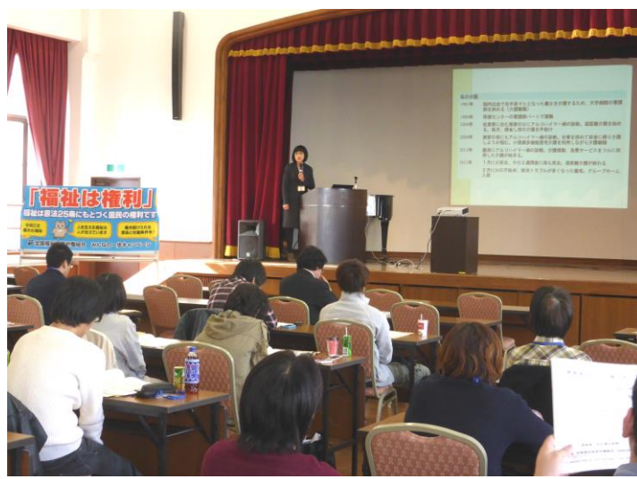
昨年開催した第22回全国交流集会の様様

今年の集会は港町神戸です。全国の仲間と学び交流して、健康で豊かに働ける職場を目指しましょう。