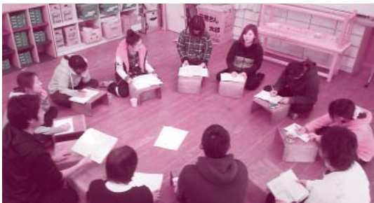
分会では話し合いを大切に