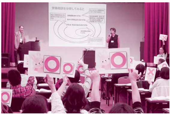
労働基準法〇×クイズで知識をつけて盛り上がり