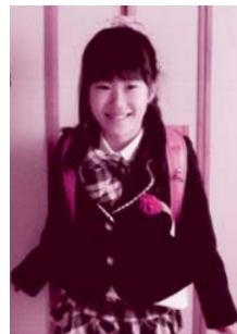
（北海道地本・長井学園分会共済会 ベンネーム 3人の母さん）