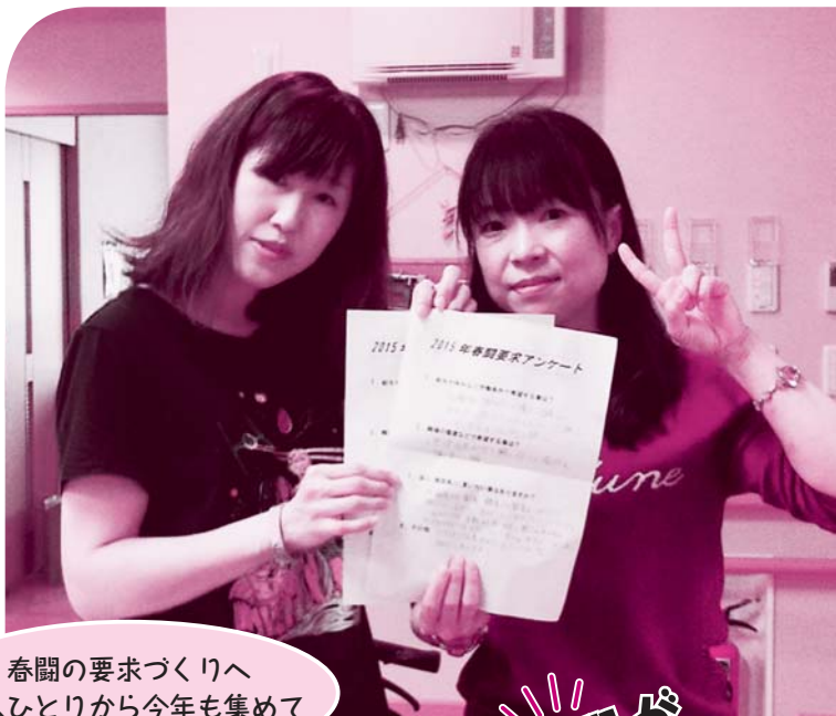
春闘の要求づくりへ 一人ひとりから今年も集めて