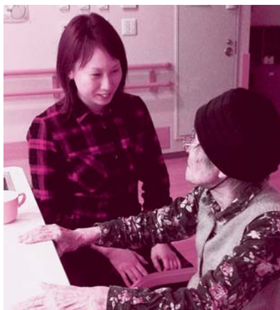
利用者の笑顔を働きがいに

北海道の東部にある北見市。特別養護老人ホームと養護老人ホームで働くなかまでつくるめぐみ会分会では、2014春闘で具体的な成果も勝ち取ったなか、2015春闘に向けてアンケートもおこない、準備をすすめています。みんなの悩みと要求を出しあひながら、前向きな変化を生んだ分会の春に向けたレポートです。