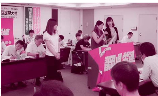
福岡県労働大会で発言する晴明保育園分会の役員（8月17日）