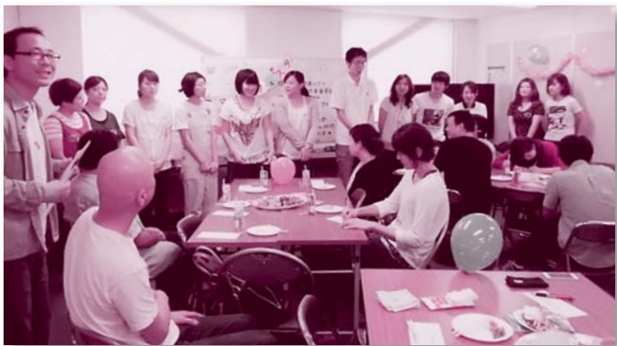
スマイルフェスタで新入組合員を紹介（8月31日）