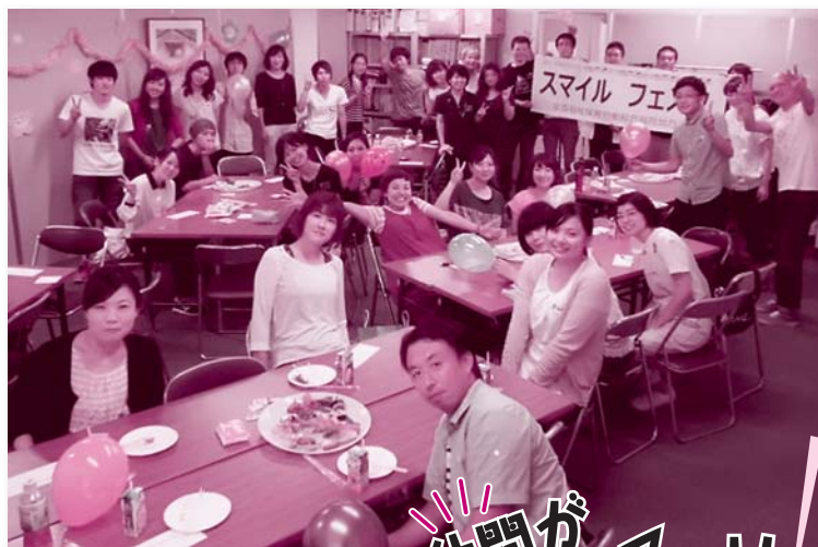
福岡地本のスマイルフェスタで「全員集合！」（8月31日）